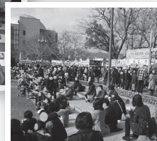
しまねあつあつ屋台村(ハノーバー庭園)↑↑