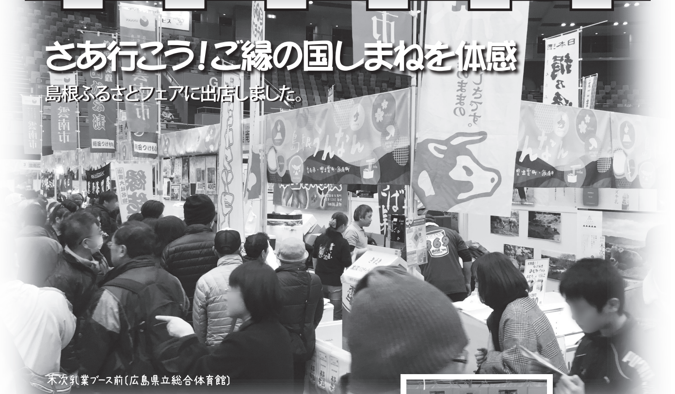
木次乳業ブース前(広島県立総合体育館)

島根の魅力を広島の皆様へ発信する冬のイベント『島根ふるさとフェア2018』が、1月20日(土)・21日(日)に広島市で開催されました。