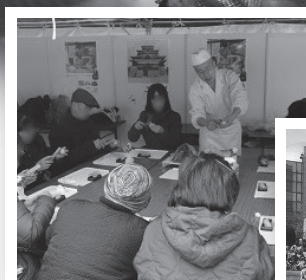
和菓子作り体験↑↑ (サンクンガーデン)

会場に足を運んでくださった皆様、木次乳業ブースにお立ち寄りくださった皆様、本当にありがとうございました。また来年、お会いしましょう!!