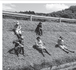
休憩時間はソーシャルディスタンスを確保して。

田植えに参加した新入社員は5名。平均年齢は18.4歳と、史上最高に若い顔ぶれでの田植えとなりました。