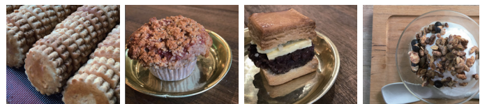
一番人気の塩麹クッキー スペルト小麦のいちごマフィン あんバタースコーン ボン菓子グラノーラ

プレーン、スペルト小麦、ライ麦×くるみ、チョコ×くるみ、メープル×ピーカンナッツ、抹茶×ダークチョコ、ダブルチョコなどのライナップ。オンラインショップでも販売。(※スペルト小麦:小麦の原種。品種改良がほとんど行われていないので身体への負担が少ない)