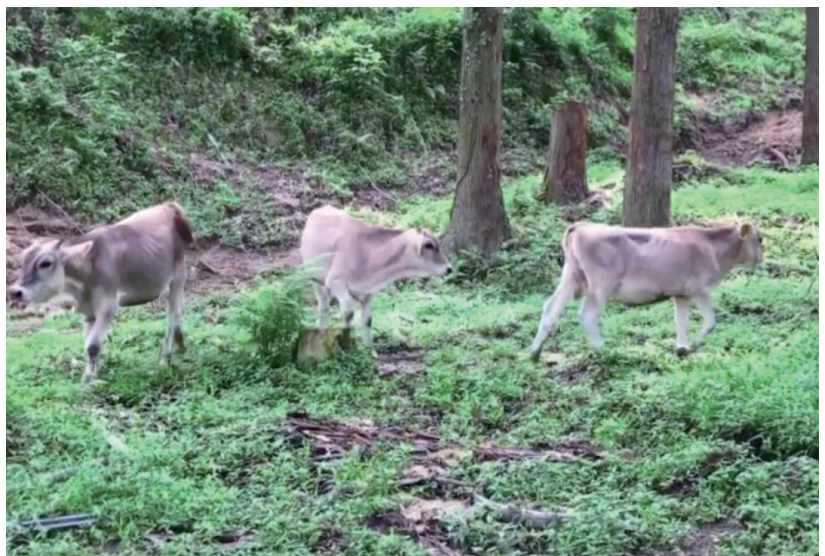
★『日登牧場』は、山地酪農でブラウンスイス種の飼育を行う、木次乳業のシンボル牧場です。