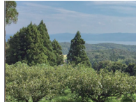
↑宍道湖を望む、北山山系（島根半島）の南向き斜面にある柿畑