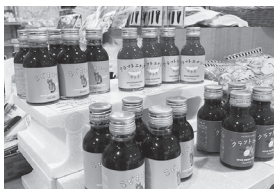
地元の会社が作る、10種類のスパイスを配合したクラフトコーラ