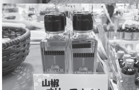
奥出雲産実山椒入り、ピリッとアクセントのきいたオリーブオイル