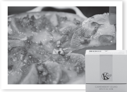
無花果とカマンベール・イズモで『無花果のデザートピッツァ』

ソテーしてレモン汁を搾った無花果、生無花果、ちぎったカマンベール、胡桃をピザ生地のにせて焼くだけ。淡白な無花果と濃厚なカマンベールはベストマッチです。少し冷ましてからがおすすめ。