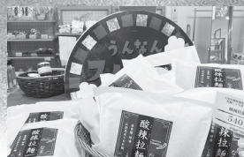
地元の人気中華料理店『ドンシュー』のおうちで楽しめるラーメン