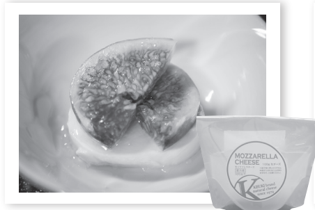
無花果とモッツアレラチーズで『無花果のカプレーゼ』

ソテーしてレモン汁を搾った無花果、生無花果、ちぎったカマンベール、胡桃をピザ生地のにせて焼くだけ。淡白な無花果と濃厚なカマンベールはベストマッチです。少し冷ましてからがおすすめ。