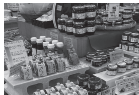
地元産唐辛子や柚子、山椒を使った調味料も勢揃い

雲南市木次町の国道54号沿いにある『道の駅 さくらの里きすき』では、9月18日から『うなんんスパイスフェア』を開催中です。