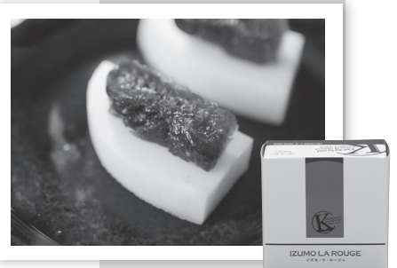
無花果とイズモ・ラ・ルーージュで『ドライいちじくのカナッペ風』

スライスしたモッツアレラにスライスした無花果をのせ、エクストラバージンオリーブオイルと岩塩をかけます。岩塩が無花果の甘みとモッツアレラの酸味を引き立て、白ワインとよく合う前菜です。