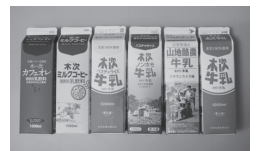
木次牛乳飲み比べセット

ハガキにクイズの答えと、お名前・ご住所・お電話番号を記入し、〒699-1323 島根県雲南市木次町東日登228-2 木次乳業 モーモータイズ No.10係 宛に送ってください。