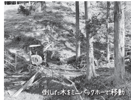
倒した木をミニバックホーで移動