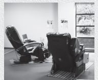
休憩室のマッサージ機

木次牛乳販売機にはパステライズ牛乳、コーヒ牛乳、木次ミルクのプリンが入っていますが、圧倒的にコーヒ牛乳がよく出ます。当施設は10年前に改修しましたが、木次牛乳販売機はそれよりずっと前からお客様に親しまれており、当施設のウリの1つとなっています。これからも木次牛乳と共に温泉を盛り上げていきたいと思っています」