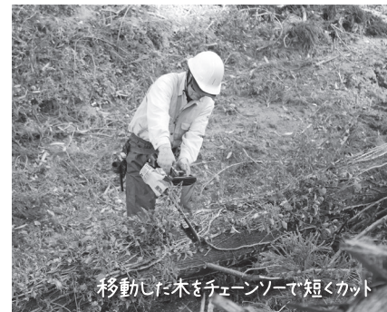
移動した木をチェーンソーで短くカット