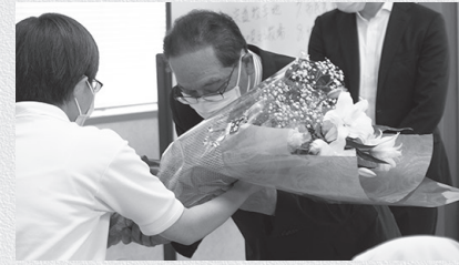
従業員からのサプライズ!! 感謝の気持ちで花束が贈られました♪